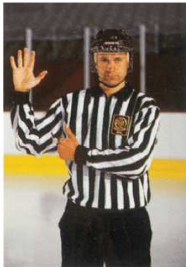
GESTE SURNOMBRE - RÈGLE 573