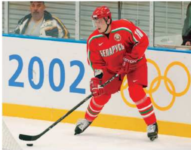
CONSERVER LE PUCK EN MOUVEMENT